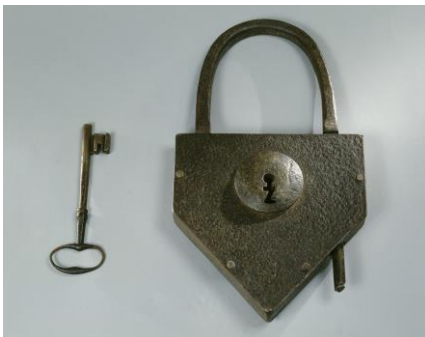
Cadenas et clef du bagne de Brest. Epoque indéterminée. Fer.