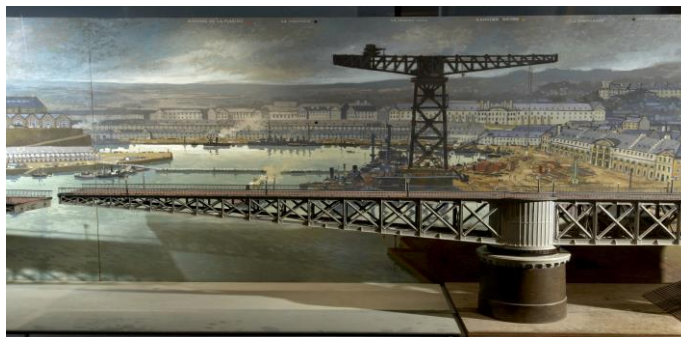
Le pont tournant. Détail de la maquette et du tableau de Pierre Péron