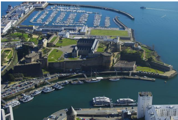
Vue du château de Brest

Découvrir l'histoire maritime de Brest à travers le château et les ports. Comprendre l'impact de la situation géographique du château et de Brest dans l'évolution économique, urbanistique, démographique et identitaire de la ville. Découvrir l'évolution des navires, du XVIII e siècle jusqu'à aujourd'hui.