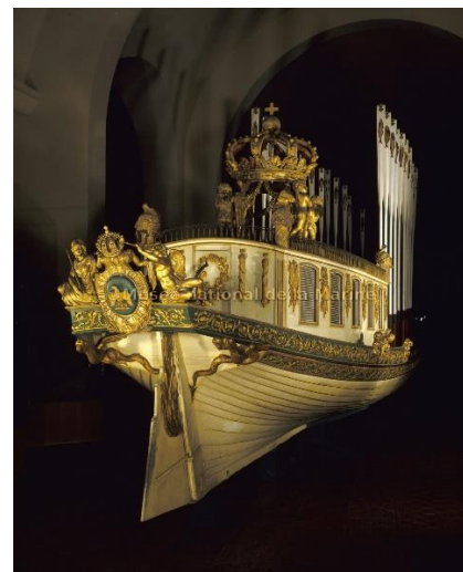
Canot de l'Empereur