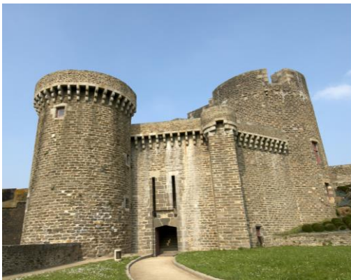
Vue du Donjon du château.