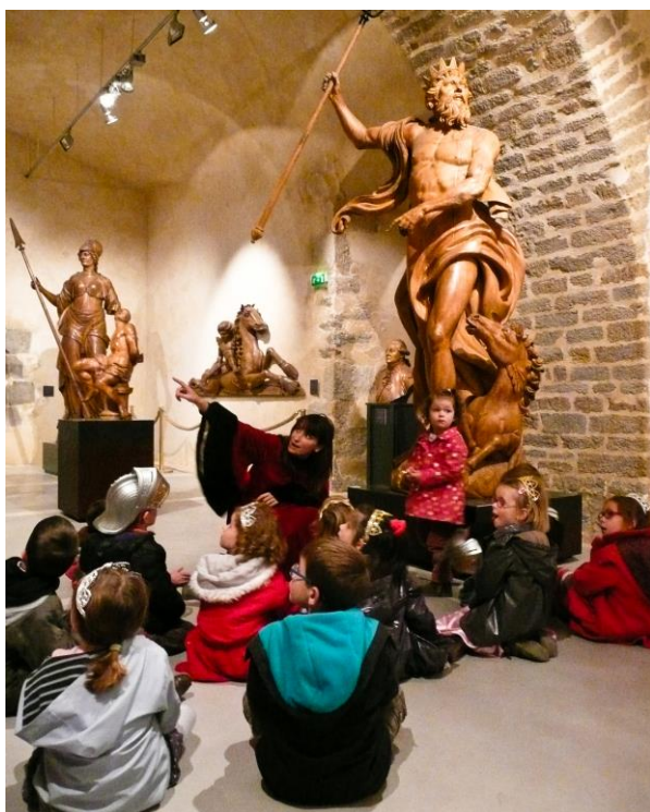
Portant heaumes et diadèmes, les enfants découvrent le Moyen-âge à Brest.

Découvrir un site historique et la notion de musée. Comprendre les fonctions et l'architecture d'un château fort et avoir une approche historique du Moyen-Age. Faire la distinction entre l'immédiat et le passé. Découvrir en s'amusant, en se déguisant et en jouant, des personnages, métiers, légendes et modes de vie du passé.