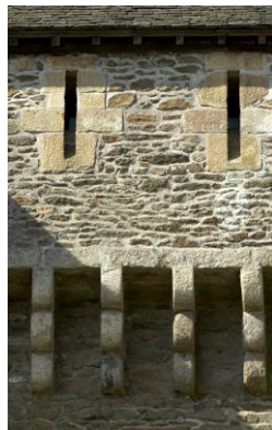
Meurtrières et corbeaux.