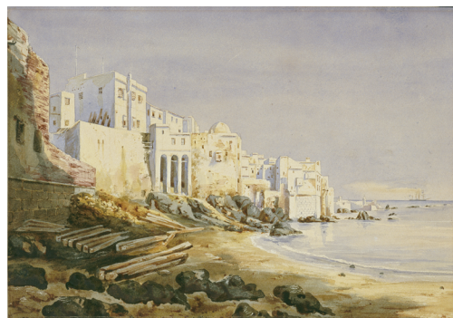
Les anciens remparts d'Alger, vers 1837, François-Edmond Pâris, Aquarelle sur papier, Musée national de la Marine, inv. 15 OA 70

En 1833, il part se perfectionner en Angleterre, alors à la pointe de la recherche dans ce domaine. Il passera trois mois dans une usine de fabrication de machines puis embarquera sur des paquebots pour étudier ce nouveau genre de navigation.