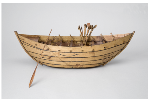
Chelingue, ou Masula-Manché, de Pondichéry, 1873, Maquette réalisée par Frédéric Baude d'après les plans de l'amiral Pâris, Bois cousu, Musée national de la Marine, inv. 9 EX 6

Le musée de la Marine naît au milieu du XVIIIe siècle, lorsqu'une collection de maquettes de navires offerte à Louis XV par Henri-Louis Duhamel du Monceau (1700-1782) est déposée au Louvre.