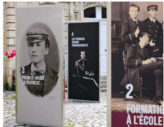
Exposition temporaire « Pierre Loti et la Marine »

Depuis plusieurs années à Rochefort, ainsi qu'à Brest, le musée présente dans son parcours permanent des reproductions de documents issus des fonds d'archives du Service historique de la Défense à Rochefort. Pour la saison 2023/2024, des photographies de la Direction des constructions navale sont mises à l'honneur, témoignages exceptionnels de l'activité de l'arsenal de Rochefort des années 1860 à la Première Guerre mondiale.