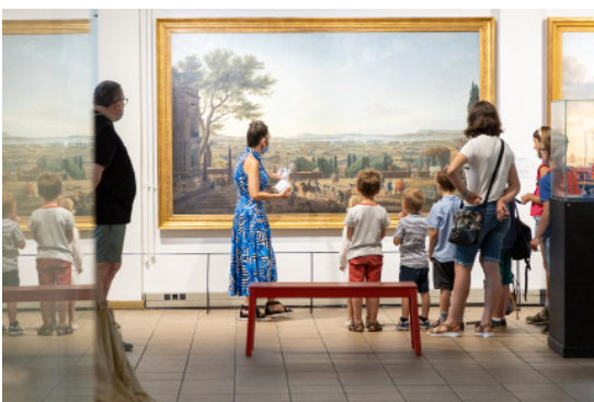
Vue du musée national de la Marine à Toulon

Rassemblement majeur du monde maritime qui célèbre durant une semaine les traditions des gens de mer en Méditerranée, Escale à Sète est une biennale maritime qui rassemble plus de 300 000 visiteurs autour de 120 bateaux traditionnels. Le musée national de la Marine est le parrain culturel de la manifestation depuis 2022. Dans ce cadre, il organisera le 27 mars 2024 une journée de rencontres et conférences consacrées au patrimoine maritime immatériel. Par ailleurs, le musée sera présent durant toutes les festivités et proposera aux visiteurs des animations, ateliers.