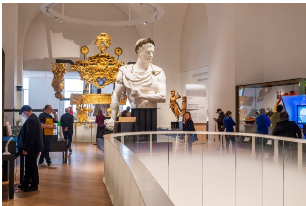
Vue de l'escalier « Représenter le pouvoir : la sculpture navale »

Sur cette période, ce sont 686 214 personnes qui se sont rendus dans l'un des six sites du musée, à Paris et sur le littoral à Brest, Port-Louis, Rochefort et Toulon.