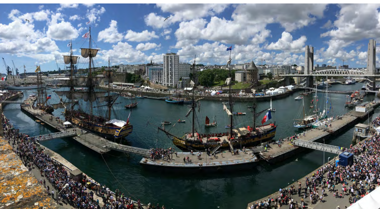
Vue sur la Penfeld depuis le château de Brest

Les reconstituants historiques remontent le temps au moyen d'installations de garnisons militaires de différentes époques, de démonstrations, de présentations de matériel de combat et d'abordage, etc.