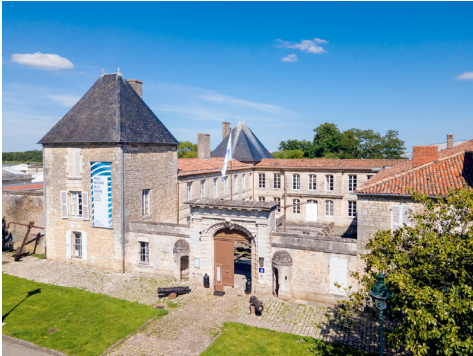
Musée national de la Marine, Rochefort