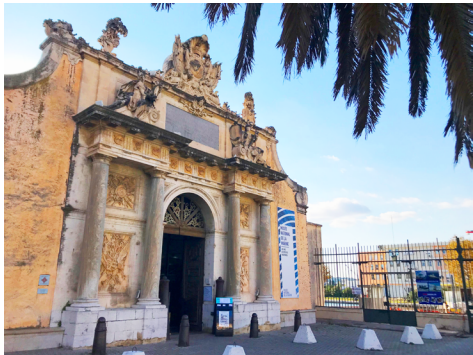
Musée national de la Marine, Toulon