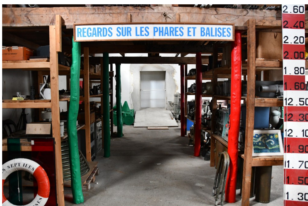
DIRM NAMO, Division des Phares et Balises de Lézardrieux