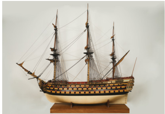
Royal Louis, vaisseau, vers 1770, atelier de modèles des Arsenaux

Incontournables du musée, les modèles de navires témoignent d'usages variés, dont le premier était d'instruire les futurs officiers de marine et ingénieurs navals. Un vaste panorama est présenté, des bateaux-jouets aux modèles les plus imposants, jusqu'à plus de 5 mètres de long !