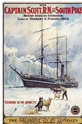
With Captain Scott to the South Pole, 1912, Herbert Ponting

Après avoir découvert les différentes ambiances sonores des films présentés dans l'exposition temporaire, les jeunes visiteurs vont en atelier pour créer une bande-son originale à partir d'une affiche de film : enregistrements, mixage, utilisation d'une banque de sons... toutes les créations sont permises ! Avec l'application Audio Room .