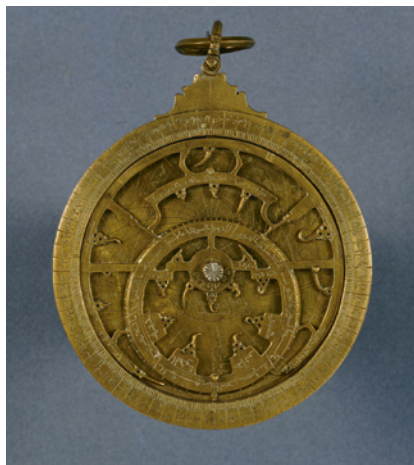
Astrolabe planisphérique, Anonyme, 16 e siècle

Comment se repérait-on en mer dans l'Antiquité et jusqu'au XX e siècle, et comment le fait-on aujourd'hui ? Au moyen de cartes, boussoles ou encore lentilles de phares, cet espace revient sur l'évolution des instruments de navigation à différents endroits du globe, depuis les premières cartes marines jusqu'au satellite Galileo.