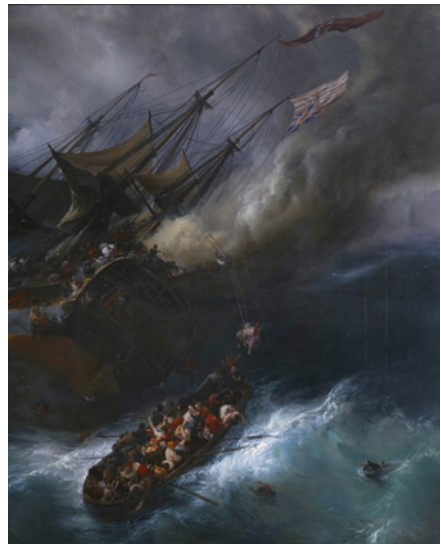
Incendie du Kent (1825), Théodore Gudin (1802-1880), (détail)

Parcourez les collections et réalisez votre propre carnet de voyages.