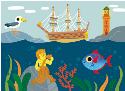
Le voyage de Bulle

Après avoir rencontré plusieurs figures emblématiques (le pêcheur, le corsaire, le matelot...), les enfants choisissent leur chapeau préféré. En atelier et en famille, ils s'observent dans un miroir pour énumérer les différents éléments de leur visage puis réalisent leur autoportrait de marin.