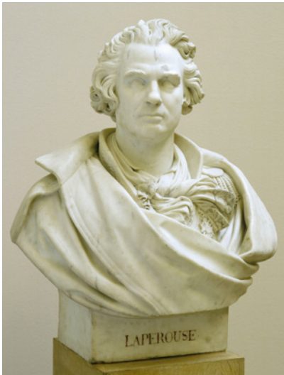
Buste de Jean-François de Galaup de Lapérouse (1741 - 1788), par François Rude, 1830 (?)

À travers des histoires de navires et de marins, de la diversité de leurs métiers et de leurs savoir-faire, cette galerie permet au visiteur de comprendre l'évolution, le rôle et les missions de la Marine nationale, ainsi que le développement de la marine de guerre française depuis le XVII e siècle jusqu'à nos jours. Un focus particulier est consacré aux innovations tactiques et technologiques.