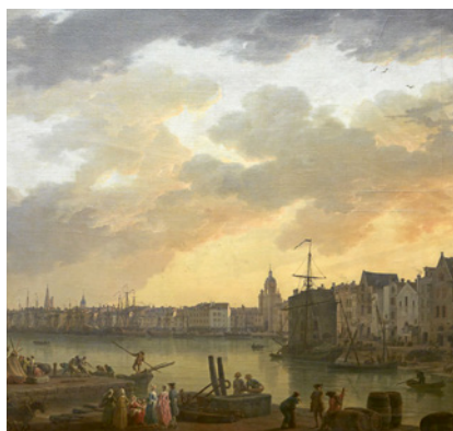
Vue du Port de La Rochelle, prise de La Rive (détail), Joseph Vernet (1714-1789)

Cette série commandée par Louis XV de quinze peintures grand format, dont treize exposées au musée, représente les ports de France de la seconde moitié du XVIII e siècle et constitue un ensemble patrimonial exceptionnel. Outil politique au service du pouvoir royal, ces tableaux sont des chefs-d'œuvre dans lesquels les scènes maritimes et portuaires du quotidien subliment l'activité foisonnante de l'époque.