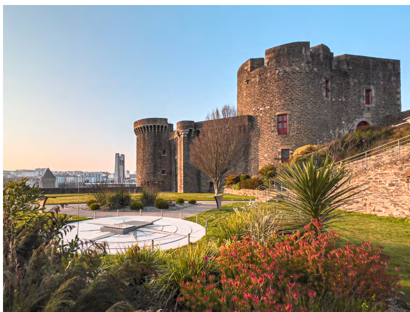
Vue du Château de Brest

Le musée présente des œuvres très diversifiées qui retracent, jusqu'à nos jours, l'histoire maritime du grand port voulu par Richelieu. Dans le Donjon, superbement rénové, sont évoqués les grandes heures de l'arsenal et de l'art la décoration navale. L'histoire émouvante du baigneur et du rôle de Brest dans la guerre d'Indépendance américaine complètent l'exposition permanente. Dédiées à la Marine du XIX e siècle à nos jours, les tours Paradis abritent objets du bord, peintures et modèles, qui évoquent la révolution industrielle, la Marine d'après-guerre, les sous-marins et la course au large.