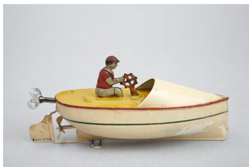
Canot-automobile mécanique, bateau-jouet.

Dès le XVIII e siècle, les moyens de suppléer à l'action des vents pour la marche des bateaux sont des sujets de recherche. Inventions et mises au point se multiplient au XIX e siècle. L'apparition du moteur à explosion et le développement spectaculaire de l'automobile amènent à utiliser ce mode de propulsion pour la navigation sur l'eau. Le public de la Belle Époque, épris de modernité, se passionne pour ces canots légers aux formes profilées s'affrontant dans des courses de vitesse et d'endurance.