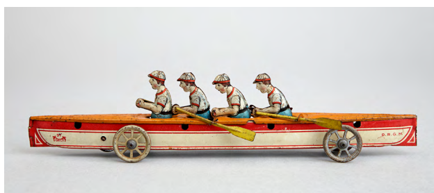
Skiff roulant, bateau-jouet. Gely (fabricant)