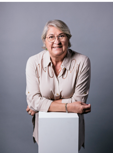
Nathalie Lorson © Firmenich