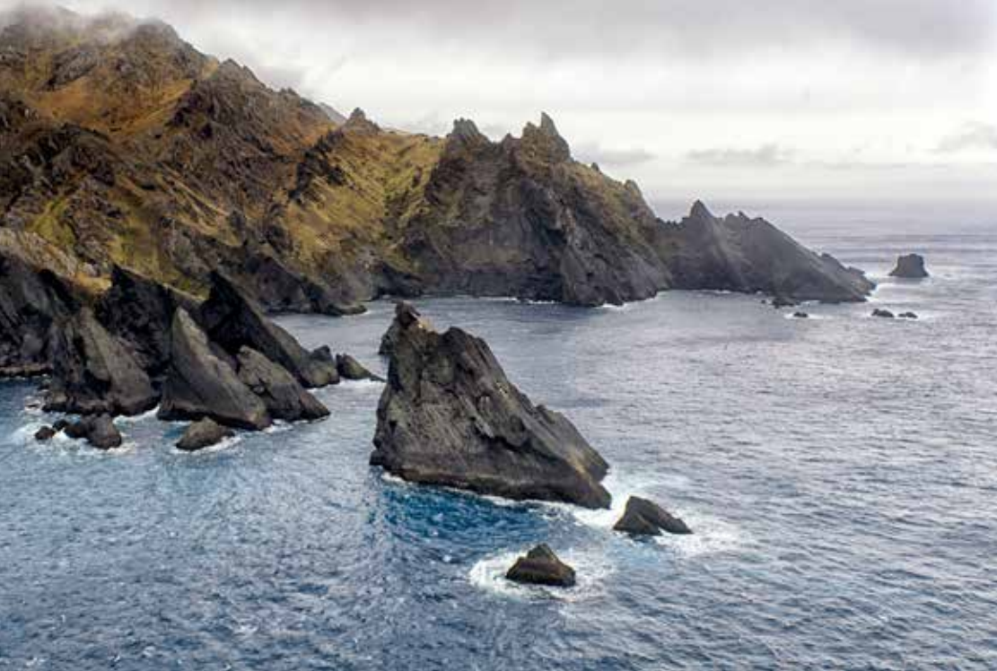
Pointe des Moines, Crozet