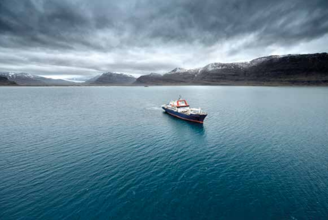
Le Marion Dufresne, navire ravitailleur des bases australes dans la baie de la Table, à Kerguelen