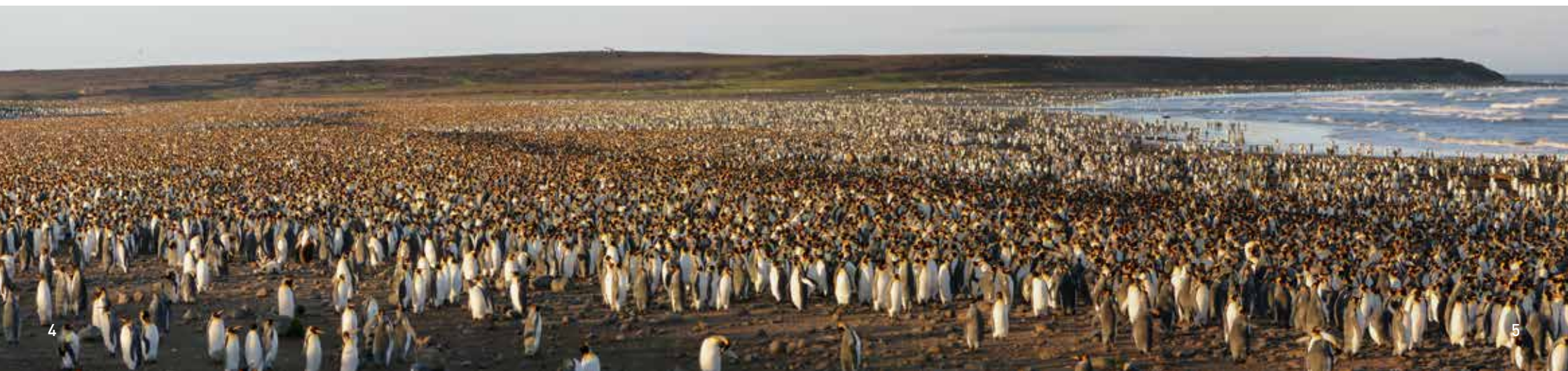
Colonie de manchots royaux, cap Ratmanoff, archipel Kerguelen