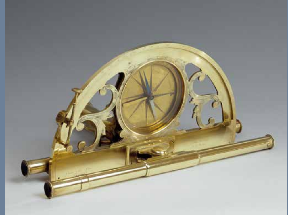
Graphomètre, 1765