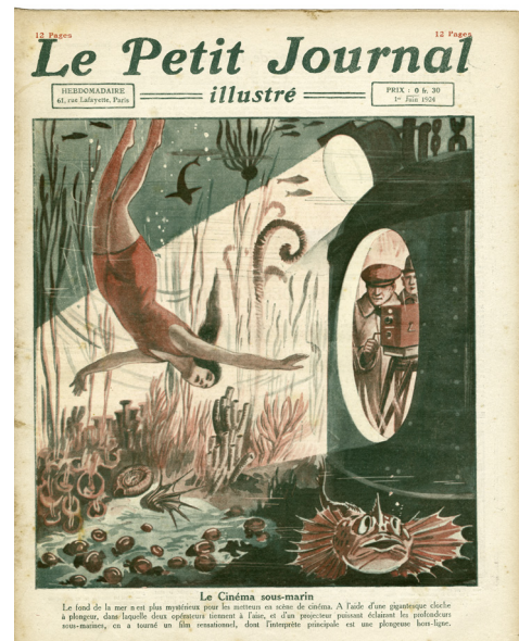
« Le Cinéma sous-marin », Le Petit Journal illustré, 1er juin 1924

Catalogue de l'exposition, coédition Lienart/Musée national de la Marine, prix public : 39€