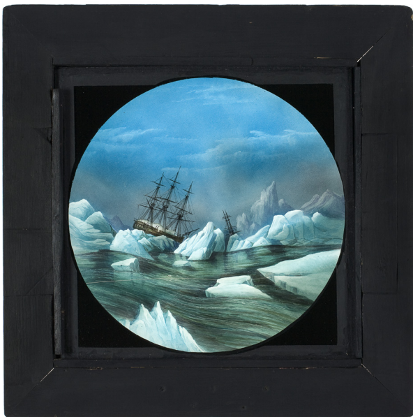
Plaque de lanterne magique peinte à la main : Arctic Scene , William Robert Hill, Royal Polytechnic, Londres, c. 1860

Ce n'est pas un hasard si le thème de la mer est récurrent dans le répertoire du cinéma : la masse des vagues sans cesse en mouvement, les mystères de la vie aquatique, les tréfonds longtemps impénétrables, les bêtes parfois monstrueuses qui habitent les océans, le caractère dramatique des tempêtes et des naufrages, la vie éprouvante des marins, les batailles maritimes, fascinent depuis toujours les artistes et chercheurs en images animées. Les thèmes du départ, du voyage, du lointain, de l'aventure, de l'exotisme, sont très tôt liés à l'iconographie des vaisseaux et bateaux, des terrae incognitae , des pirates, des hollandais volants et des animaux fantastiques.