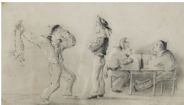
Le matelot au lapin

1833 Dessin signé « Casat » Papier (mine de plomb, aquarelle) H. 13,2 cm, 23,2 cm Scène satirique représentant un matelot en uniforme [de la Marine] affolé car tenant un lapin dans sa main. L'aurait-il trouvé à bord ?