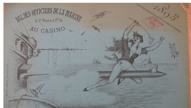
Invitation au bal des officiers de la Marine

1893 H. 15,9 cm, l. 21,7 cm Papier cartonné Fabricant Lith. A. Isnard & Cie Scène représentant une femme à califourchon sur un missile tiré, d'où s'envolent des lapins. C'est la réunion de deux superstitions des marins à bord : les femmes et les lapins...pour un concentré de tous les risques ! © musée national de la Marine