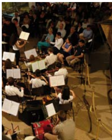
Concert, Toulon

Programme sur demande et disponible environ 10 jours avant le concert. Se renseigner au 04 22 42 02 01.