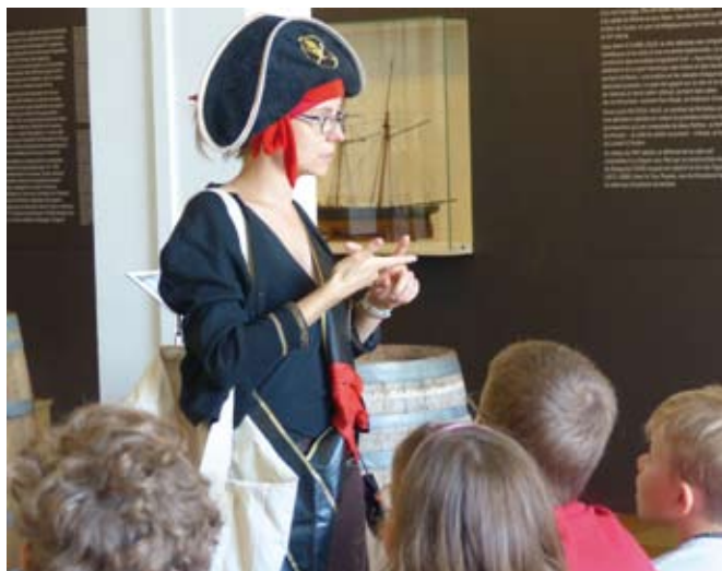
Animation enfants