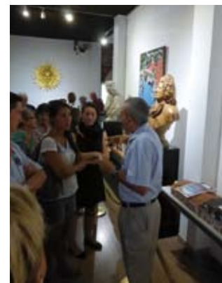
Visite scolaire, Toulon

→ Toutes les activités sont soumises à réservation. Contact : resatoulon@musee-marine.fr 04 22 42 10 61