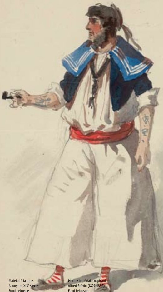
Matelot à la pipe. Anonyme, XIX e siècle Fond Letrosne