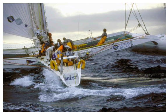
Couverture du Tour du monde en 80 jours , Jules Verne, J. Hetzel, 1897

L'exposition, racontée par les acteurs qui rendent compte avec force de leurs odyssees collectives, se termine en interrogeant l'avenir du défi, au regard des avancées technologiques et des tentatives actuelles. En 25 ans, le temps de la chevauchée a été divisé par deux, une évolution que nulle autre discipline sportive non motorisée n'a connue. Peut-on s'attendre à un tour du monde en 20 jours d'ici 2040 ?